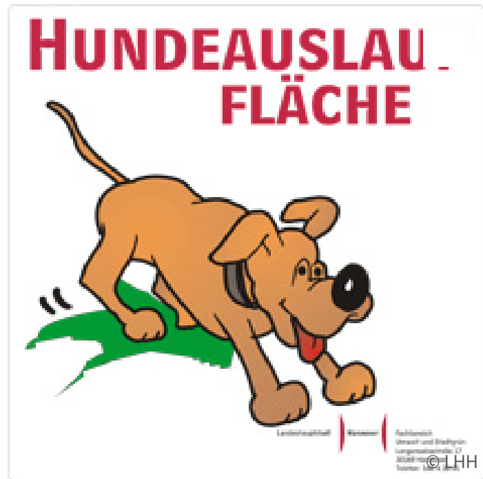
Schild, das eine Hundeauslauffläche ausweist

Die Ausnahmegenehmigung gilt nicht während der allgemeinen Brut-, Setz- und Aufzuchtzeit vom 1. April bis zum 15. Juli in Wäldern und in der freien Landschaft und nicht in den Gebieten und an den Orten, an denen Hunde angeleint werden müssen wie z. B. im Stadtbezirk Mitte oder innerhalb eines Umkreises von 50 m zu Kindertagesstätten und Schulen.